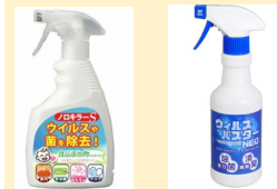
ノロキラーS ウィルスバスター-NEO