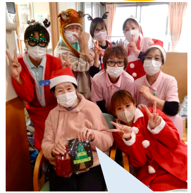
とても楽しかったわ😊 動画も素敵でした😊 ありがとうございます♪