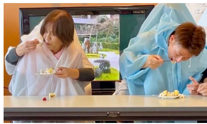
私たちの団結力を 今こそみんなに 見せてあげましょう👊 こんなの楽勝よね～😊