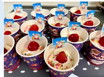
手作りのケーキ😊 大好評でした😊