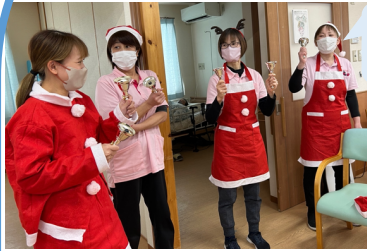
クリスマス会盛り上がり～😊