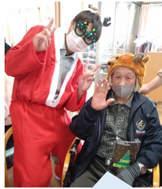
ワシも楽しかったよ😊