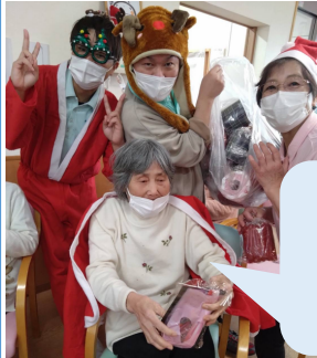
いい声ですね😊 上手～👏👏👏